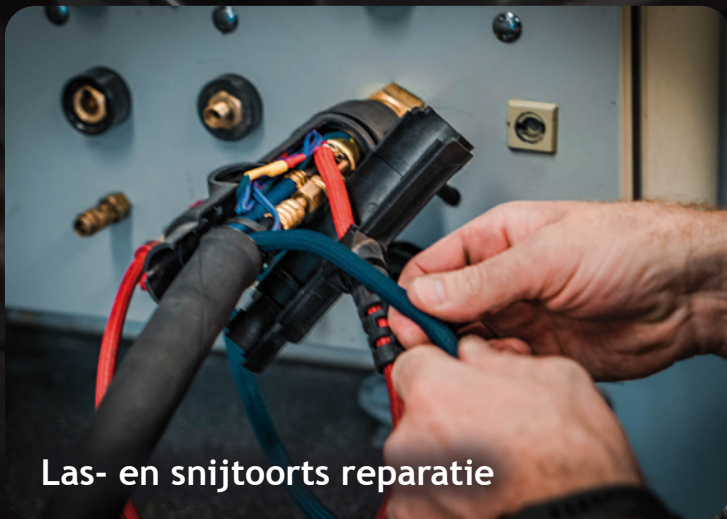
Las- en snijtoorts reparatie

Goed onderhoud aan uw lasmachines vermindert het aantal storingen en het verlengt de levensduur van het apparaat. Daarnaast waarborgt het de veiligheid van de elektrische apparatuur, zoals de Arbo-wet eist. Daarom is het belangrijk om uw machinepark minimaal één keer per jaar door onze vakbekwame monteurs te laten onderhouden en keuren. Met deze keuring wordt een elektrisch veilige werking van machines en apparatuur nagestreefd, volgens de NEN-EN-IEC 60974-4 norm en voldoet u aan de verplichtingen van de Arbo-wet. Bij goedkeuring ontvangt u een rechtsgeldig certificaat of een overzichtslijst van de gekeurde apparatuur.