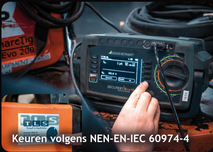
Keuren volgens NEN-EN-IEC 60974-4