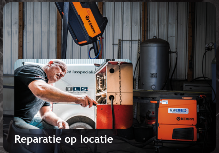
Reparatie op locatie