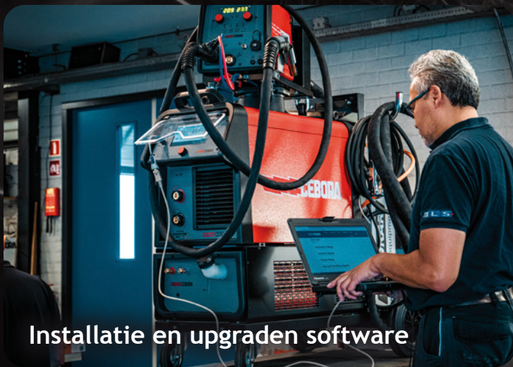
Installatie en upgraden software